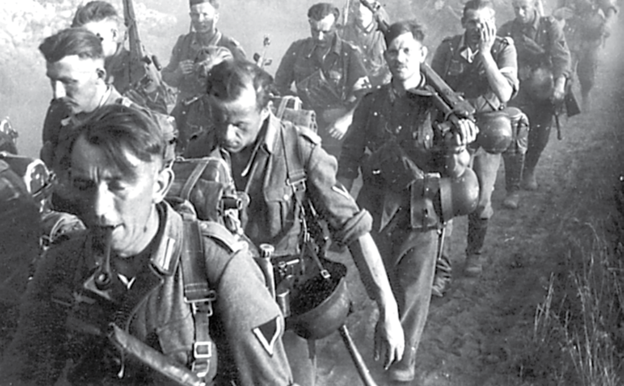
Parašiutininkai jėgeriai žygyje Lietuvoje. 1944 m.

Estijoje, kur trumpą laiką buvo pavaldus SS tankų korpuso 3-iajam (germanų) batalionui, tačiau operacijose jis taip ir nedalyvavo.