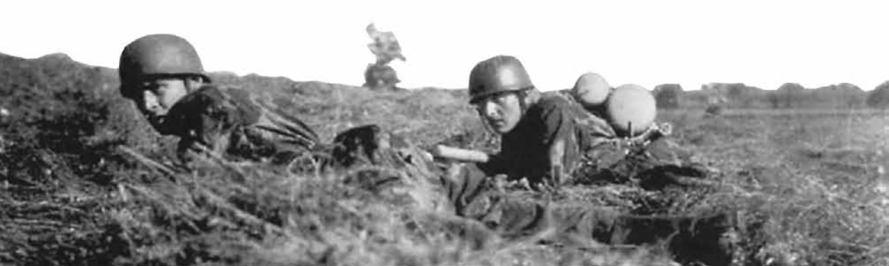
Parašiutininkai pozicijose. Lietuva. 1944 m.

Demjanske ir Cholme stabilizuojant padėtį fronte, baigėsi tuo, kad vos per keletą dienų subyrėjo ne tik 3-iosios tankų armijos, bet ir visos „Centro“ armijų grupės fronto linija.