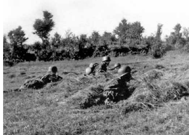
Parašiutininkai jėgeriai pozicijose pasirengę kovai. Lietuva. 1944 m.

1944 m. liepos 13 d. grupė „Kaunas“ pajudėjo Lentvario kryptimi į pagalbą Štahelio grupei. 6-osios tankų divizijos kovos grupei pavaldžiam SS 500-ajam parašiutininkų jėgerių batalionui, kaip pėstininkų daliniui, buvo pavesta užtikrinti tankų pulko „Didžioji Vokietija“ 2-ojo bataliono saugumą. Kartu su puolimo grupe riedėjo maždaug 300 tuščių automobilių, skirtų sužeistiesiems evakuoti.