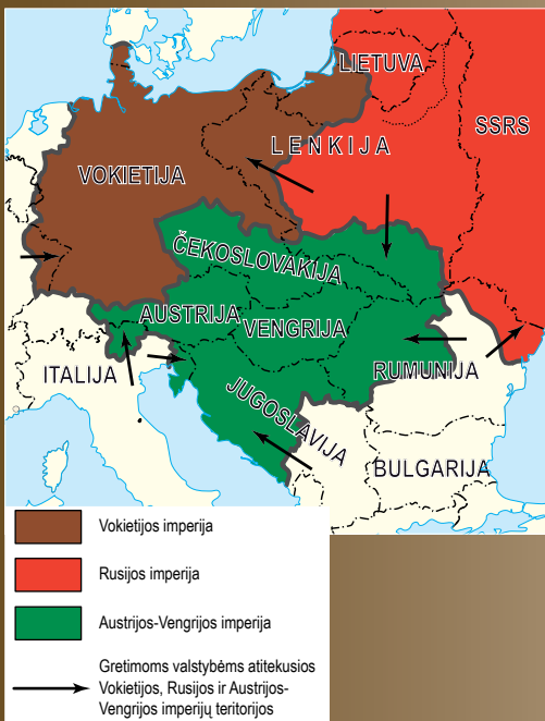
Nr. 18. Europos valstybių sienų kaita po Pirmojo pasaulinio karo.

Po Pirmojo pasaulinio karo žlugo trys daugianacionalinės imperijos (Austrija-Vengrija, Rusija ir Turkija). Prie šio sąrašo galima priskirti ir Vokietijos imperiją, nors ši valstybė, priešingai pavadinimui, buvo apgyvendinta vienos vokiečių tautos. Didžiulėse tūkstančių kilometrų erdvėse įsigalėjo chaosas, anarchija, visų karas prieš visus. Pamažu šitame verdančiame katile išsikristalizavo naujos naujų valstybių sienos. Viena iš tokių naujų valstybių tapo niekada anksčiau neegzistavusi Čekoslovakija. Be to, iki pasaulinio karo pradžios dvi jos sudėtinės dalys buvo skirtingose valstybėse: Bohemija ir Moravija (Čekija) priklausė pačiai didžiausiai pagal gyventojų skaičių ir labiausiai ekonomiškai išsivysčiusiai Austrijos imperijos daliai, o teritorija, pavadinta Slovakija, priklausė Vengrijos karalystei.