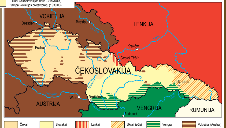
Nr. 20. Čekoslovakijos gyventojų tautinė sudėtis iki 1938 m.

Versalio sutarties ir Sen Žermeno taikos konferencijos sprendimais vakariniame ruože Čekoslovakijos siena buvo nubrėžta per prieškarinę Bohemijos ir Vokietijos sieną. Taigi naujos valstybės teritorijoje atsidūrė kompaktiškai apgyvendinti vokiečių (galima sakyti, „austrių“) rajonai. Dar daugiau, vokiečiai šioje naujoje valstybėje tapo