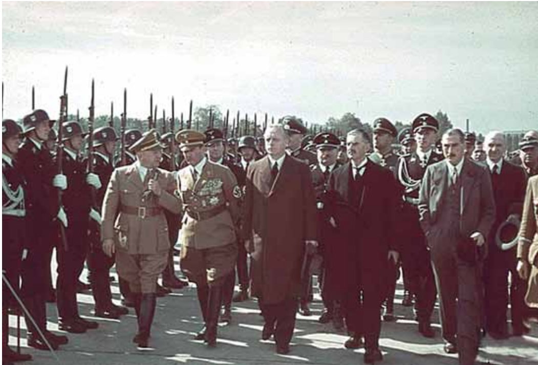
Miunchenas. 1938 m. rugsėjo 30 d.